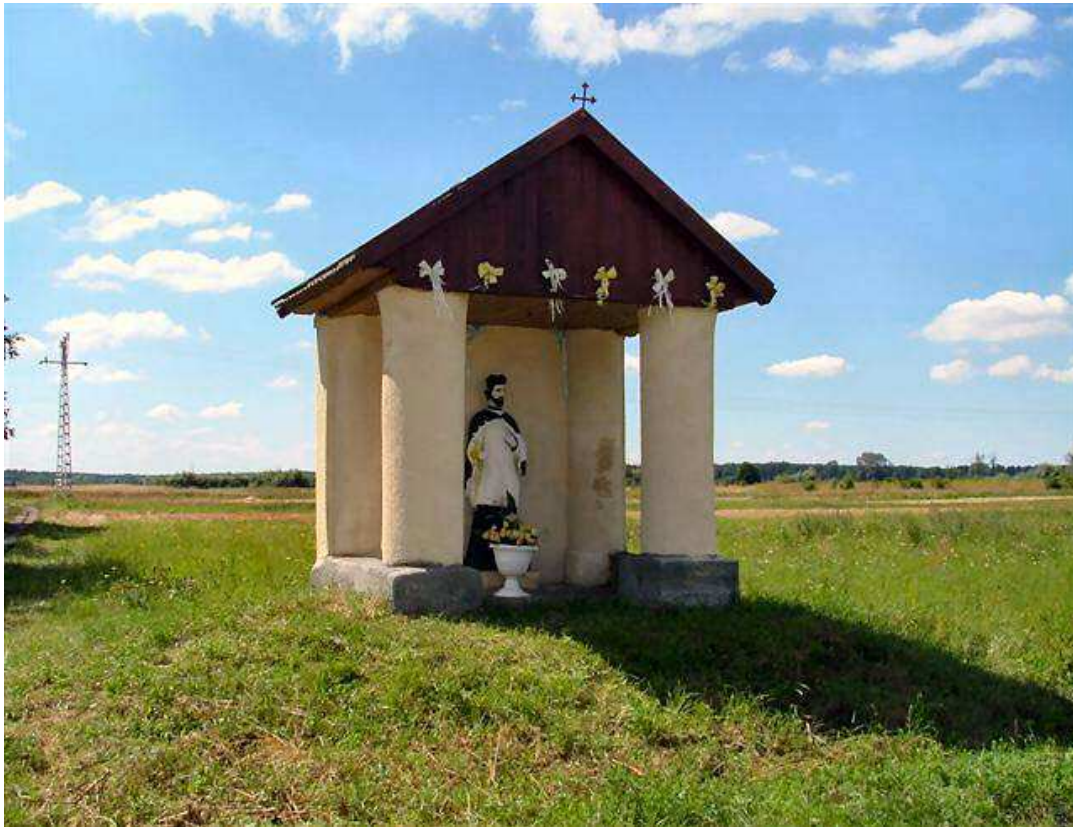
Figura św. Jana Nepomucena przy wjeździe do Majdanu Zbydniowskiego.