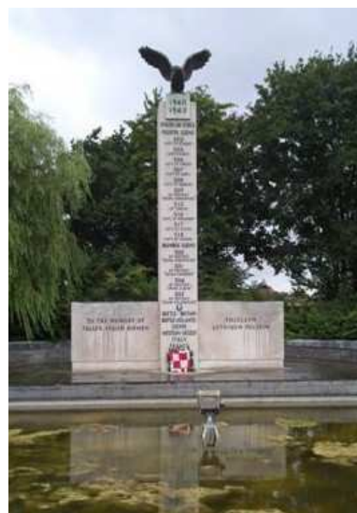
Pomnik Lotników Polskich w Northolt w Wielkiej Brytanii.