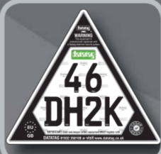
CESAR ID Triangle

Ten elastyczny samoprzylepny transponder zawiera niepowtarzalny numer identyfikacyjny, który jest trwale zaprogramowany w jego wewnętrznym układzie scalonym i znajduje się pod/ w jednej z trójkątnych etykiet identyfikacyjnych. Numer nie może zostać zmieniony bądź usunięty i jest odporny na atak posługujący się porażeniem elektrycznym i falami magnetycznymi.